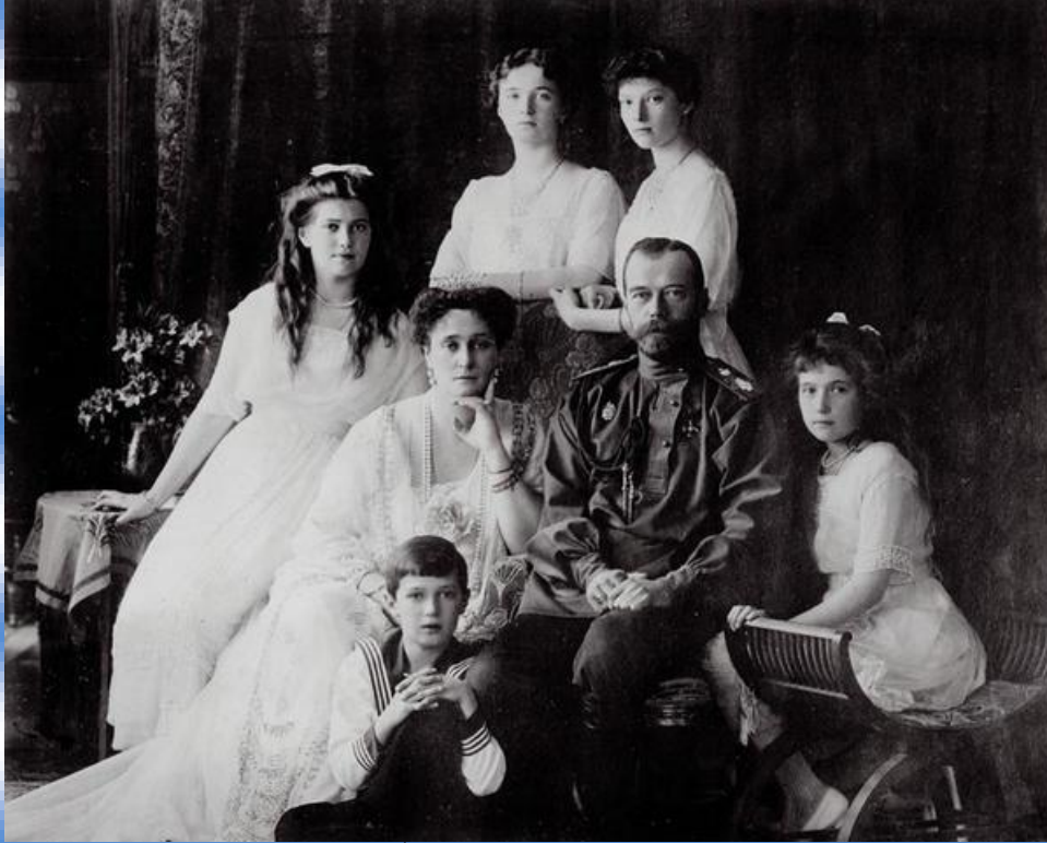
MIGUEL STROGOFF Y EL ÚLTIMO ZAR NOS ABREN LA PUERTA A UNA TARDE EN LA QUE CHARLAREMOS DE RUSIA. ES GRATIS, ¡TE ESPERAMOS!

CLUB DE LECTURA 3 DE ABRIL, 19:00 CENTRO JOVEN NAVA